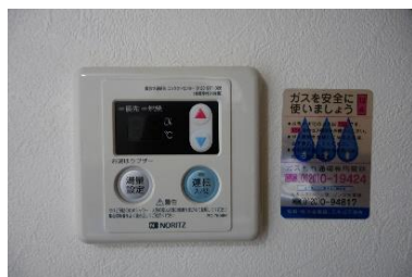
給湯器のスイッチ