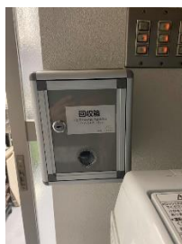
使用チェック表を提出する「回収箱」※後述